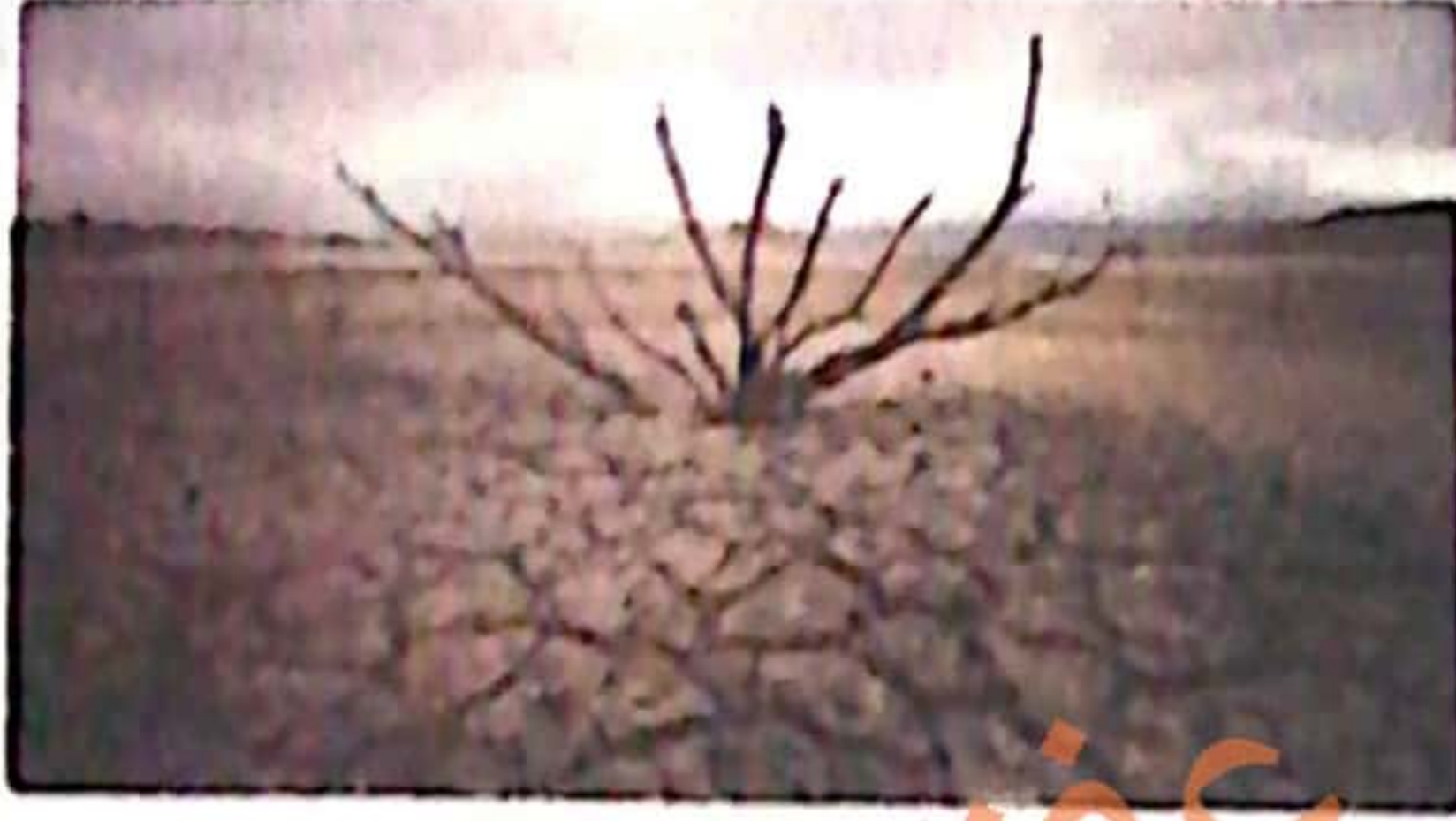
ظاهرة تصدق التربة الزراعية